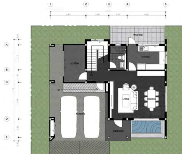
FIRST FLOOR PLAN

SCG Experience 1444 Soi Lat Phrao 87, Khlong Chan, Bang Kapi District, Bangkok 10240 Tel. 02-101-9922 # 1038 / 1005 Official Website : www.scgbuildingmaterials.com