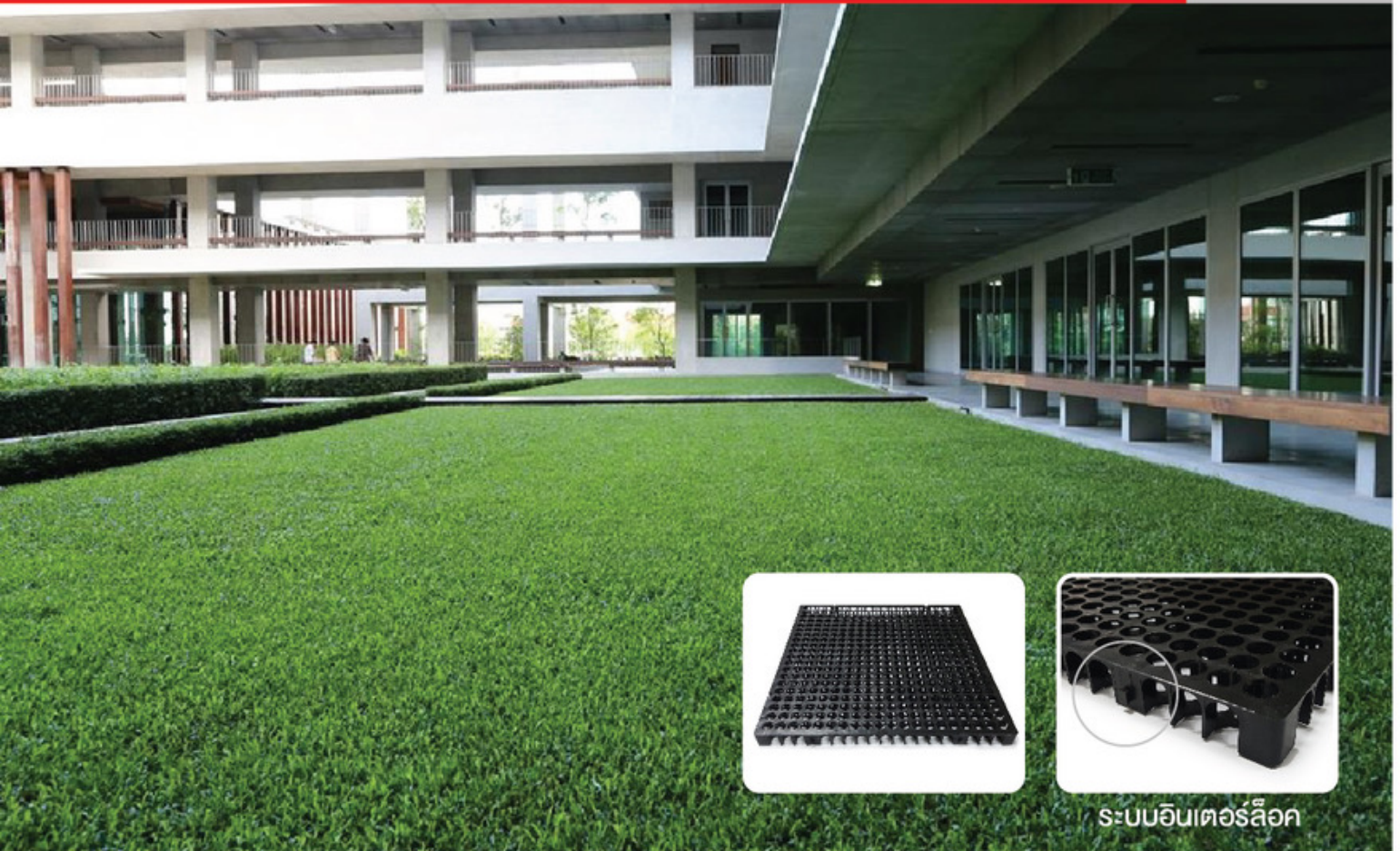
ระบบอินเตอร์ล็อก

แผ่นระบายน้ำรุ่น Drain Grid ผลิตจากพลาสติกพอลิโพรพิลีน (PP) เป็นระบบแผ่นระบายน้ำ มีน้ำหนักเบา ระบายน้ำได้ดี และมีระบบอินเตอร์ล็อก ทำให้ติดตั้งง่าย และรวดเร็ว ถูกออกแบบมาให้สามารถใช้ได้หลากหลายทั้งพื้นที่ส่วนบนอาคาร พื้นที่หญ้าเทียม หรือกระเบื้องต้นไม้