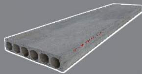
แผ่นกันดิน

ขนาด 0.30 x 0.06 x 2.92 ม. น้ำหนัก 35 กก./แผ่น