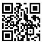
คู่มือติดตั้งสินค้าเหล่านี้

CW-WS-D-2001/6503 * สีของผลิตภัณฑ์ในภาพใช้เพื่อการโฆษณา ซึ่งอาจแตกต่างจากรีจของผลิตภัณฑ์เนื่องจากกระบวนการพิมพ์ ต้องพิจารณาสีจริงของผลิตภัณฑ์ที่ร้านค้าก่อนการสั่งซื้อ All Content, design, and layout are Copyright © 2021, SCG Cement-Building Materials All Rights Reserved, Reproduction in whole or part in any form or medium without specific written permission is prohibited